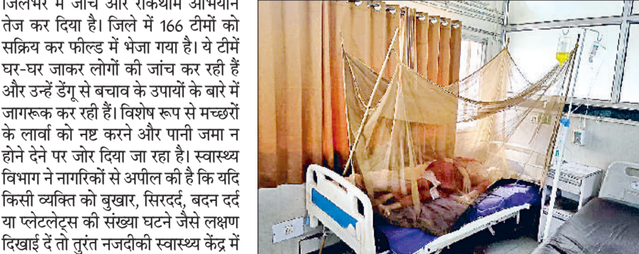
सोनीपत। डेंगू वाई में भर्ती मरीज व फोगिंग करते हुए कर्मचारी।

जिले में डेंगू का प्रकोप लगातार बढ़ता जा रहा है। अब तक जिले में 63 डेंगू मरीज सामने आ चुके हैं। इसके अलावा 14 मरीज मलेरिया और तीन मरीज चिकनगुनिया से पीड़ित पाए गए हैं। डेंगू से पीड़ित एक मरीज की हालत गंभीर होने पर उसे जिला नागरिक अस्पताल में भर्ती कराया गया है, जहां चिकित्सकों की देखरेख में उसका उपचार चल रहा है। डॉक्टरों के अनुसार फिलहाल मरीज की स्थिति स्थिर है। विभाग की तरफ से संदिग्ध स्थानों पर फॉगिंग करवाई जा रही है। ताकि बढ़ते मामलों पर नियंत्रण किया जा सके। बता दें कि जिले में डेंगू के मामलों में बढ़ोतरी को देखते हुए स्वास्थ्य विभाग ने