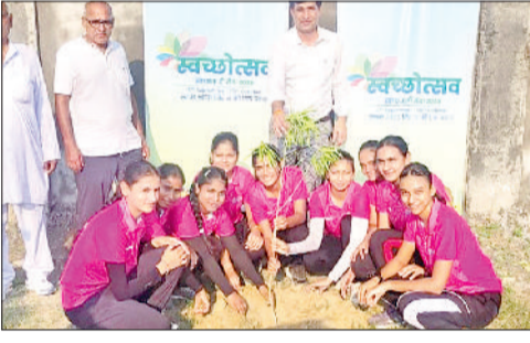
औद्योगिक क्षेत्र स्थित मैदान पर पौधारोपण करती खिलाड़ी एवं अन्य।