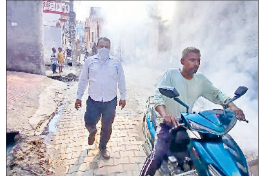
सोनीपत। डेंगू वाई में भर्ती मरीज व फोगिंग करते हुए कर्मचारी।