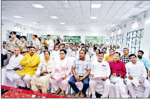
सोनीपत। बैठक के दौरान मौजूद समिति सदस्य एवं अन्य।