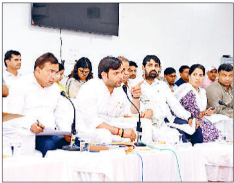
सोनीपत। बैठक के दौरान मंचासीन मंत्री, विधायक एवं अधिकारीगण।