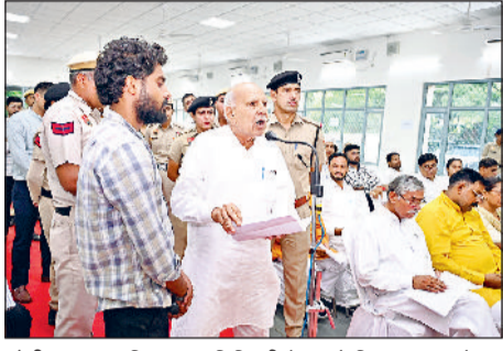
सोनीपत। कष्ट निवारण समिति की बैठक में शिकायत रखते हुए एक फरियादी।