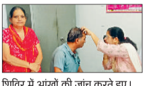
शिविर में आंखों की जांच करते हुए।