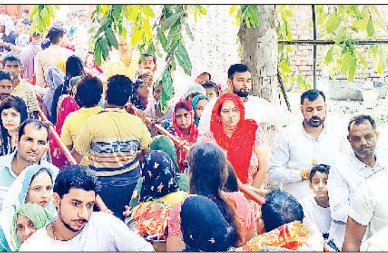
गन्नीर। दुर्गा सप्तमी पर मन्दिर में दर्शनों के गली माता के भक्त लंबी लाइन।

दुर्गा सप्तमी पर बड़ी स्थित माता महाकाली प्राचीन मन्दिर में भक्तों की भीड़ उमड़ी और माता के जयकारे गूंजे। मंदिर में पहुंची भक्तों की भीड़ ने माता दुर्गा को चुनरी, नारियल, दीपक, प्रसाद अर्पित कर परिवार की सुख शांति की मन्त मांगी। इस दौरान माता के जयकारों से मंदिर परिसर गूंज उठा और वातावरण भक्तिमय बना दिखाई दिया।