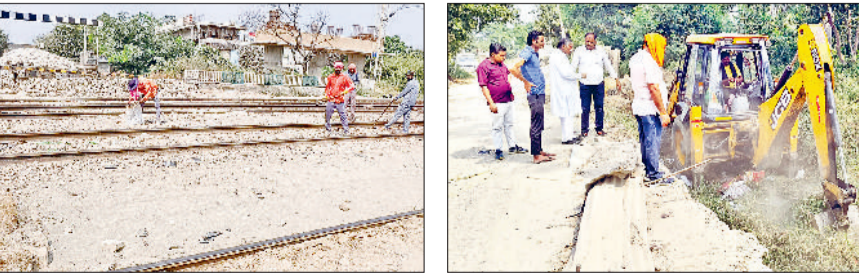
गन्नौर। फाटक पर रेलवे ट्रेक के बीच बनाए रास्ते को उखाड़ते रेलवे कर्मी व अंडरपास में वाहनों के गुजरने का रास्ता बनाती जेसीबी।